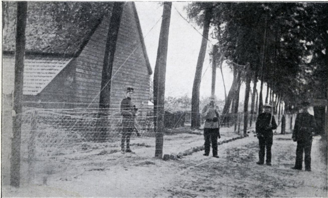
Fil barbelé. — Fil de barricade à une hauteur de 5 mètres.

Langs de noordelijke gemeenten Kieldrecht en Doel liep een kilometerslange hoogspanningsdraad waarmee België hermetisch werd afgesloten van Nederland. Op sommige plaatsen, zoals op de grens tussen Kieldrecht en Nieuw-Namen, liep deze elektrische draad gewoon tussen de huizen en de erven. Duitse soldaten bewaakten deze grens. De mensen in het dorp mochten enkel per uitzondering (met een toelatingsbewijs) de grens oversteken. De elektrische draad maakte enkele duizenden dodelijke slachtoffers, vooral smokkelaars. Maar ook kinderen en jongvolwassenen kwamen om omdat velen de gevaarlijke effecten van hoogspanning niet kenden.