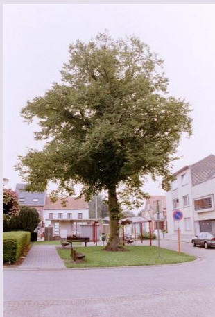
Vredesboom aan het Verheyenplein in Verrebroek

Een handige brochure rond Vredesbomen, kan je hier terugvinden: http://www.2014-18.be/vredesbomen . Hier vind je alle informatie over het project. De site wordt nog aangevuld met praktijkvoorbeelden, promomateriaal en doorverwijzingen.