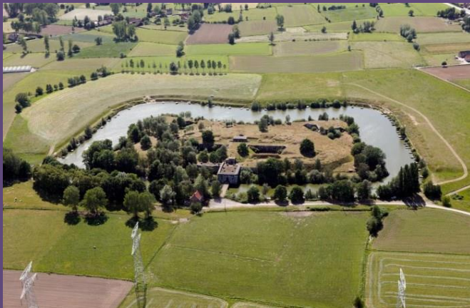
Fort van Haasdonk

Ook het pantserfort van Haasdonk, dat in oktober 1914 door de Duitsers werd buitgemaakt, maakte onderdeel uit van de Duitse verdediging rond Antwerpen.